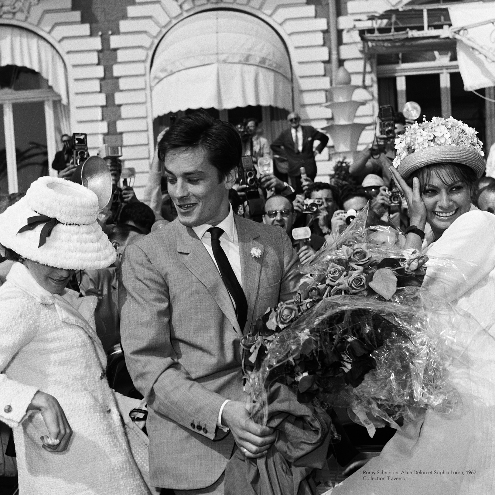
Romy Schneider, Alain Delon et Sophia Loren, 1962